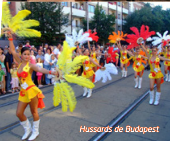
Hussards de Budapest